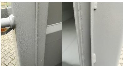
SELLADO ESPECIAL FUGAS