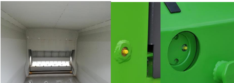
ACCESO DESDE EL EXTERIOR A TODOS LOS PUNTOS DE ENGRASE