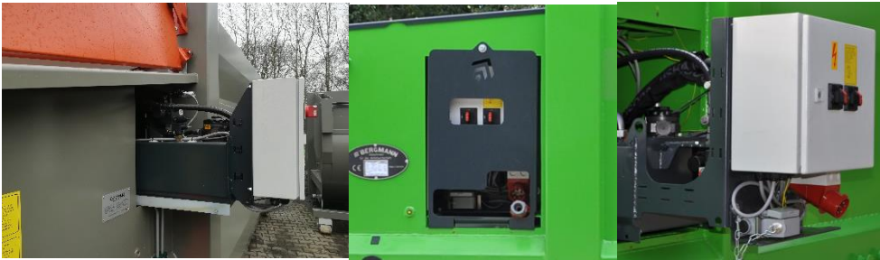
FACIL ACCESOS MANTENIMIENTO LATERAL