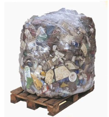
RESIDUO GENERAL >1000 kg