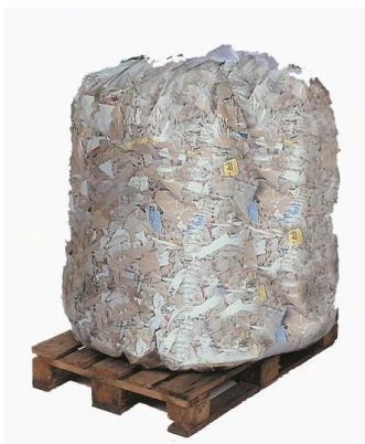
PAPEL Y CARTON >450 kg