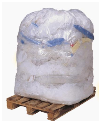
PLASTICO >120 kg