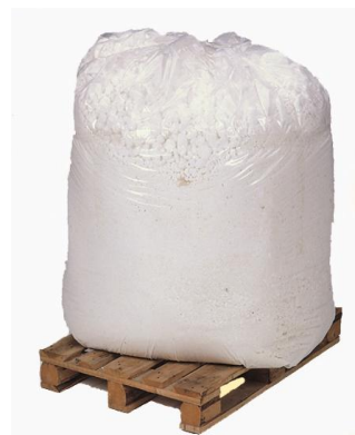
POREXPAN 50-75 kg